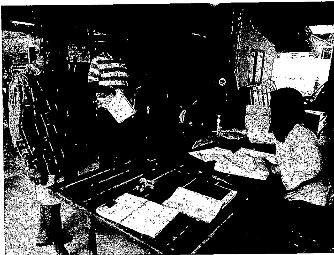
ออกให้บริการรับชำระภาษี ตามโครงการรับชำระภาษีนอกสถานที่ ประจำปี ๒๕๖๖ หมู่ที่ ๑-๗